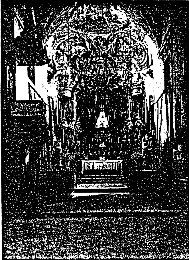
2. Der Hochaltar der Kirche von Maria-Siebing in Wien XIII. Man sieht hinter dem Altar den Baum und darin schwebend die Madonna mit Kind im kegelförmigen Peplos. (Vgl. S. 9.)