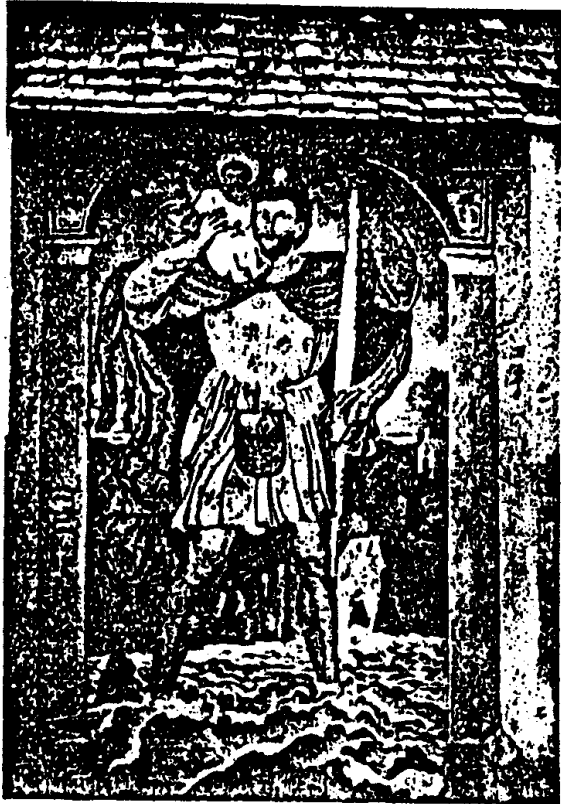
6. Romanisches Christophbild (Wandfresko) an der Kirche von Baldransdorf in Kärnten. (Vgl. S. 15.)