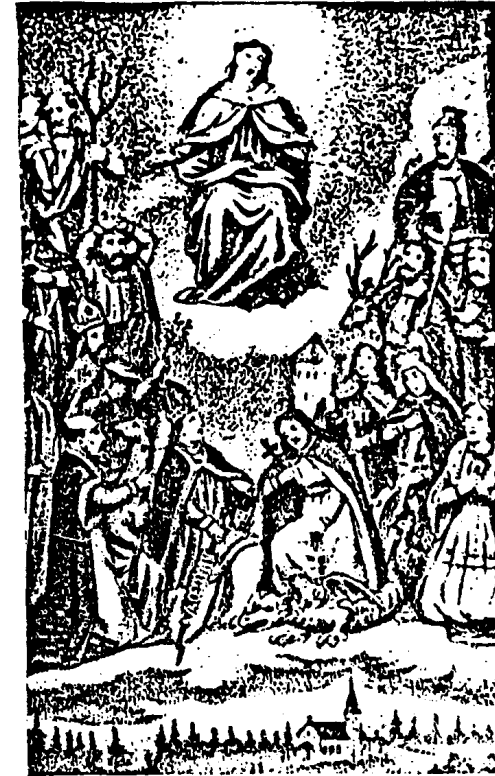
3. Die 14 Nothelfer auf einem alten Heiligenbild. In der Mitte Maria; links von oben angefangen: St. Christoph, St. Pantaleon mit den auf den Kopf genagelten Händen, St. Blasius mit den zwei Herzen, St. Dionysius mit dem Schwert, St. Kacius mit dem Azaizenzweig, St. Regidius mit der Hirschfah, St. Erasmus mit einer Wunde, auf der die Gedärme aufgewickelt sind, St. Margarete mit dem Drachen, St. Vitus, St. Katharina mit Rad, Schwert und Zahn, St. Barbara mit Schwert, Kelch und Thurm, St. Chriakus mit dem gol- denen Apfel, St. Eustach mit dem Hirshen, St. Georg. (Vgl. S. 32.)