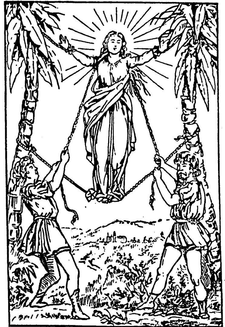
5. Ein altes Heiligenbild, das Martyrium der hl. Korona darstellend. (Vgl. S. 24.)