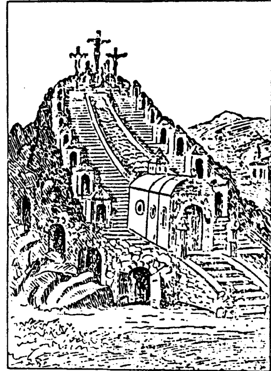
7. Der Salvarienberg in Sernals (Wien XVII) um 1714. Man sieht hier deutlich noch die Anlage eines Dürfelbergs mit dem Höhlenlabirinth. Die prähistorischen Erdställe mit ihren von Zwergen gegrabenen Höhlenlabirinth sind die natürlichen Vorbilder der künstlichen Salvarienberge gewesen. Ein ähnlicher Salvarienberg befindet sich in Vanzendorf, das einst Praedium des — historischen Lannhäuser war. (Vgl. S. 25.)