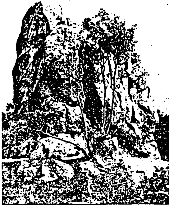
4. Das „Matterhündl“, ein natürlicher Bulvenstein im Wienerwald bei Mödling. (Vgl. S. 10.)