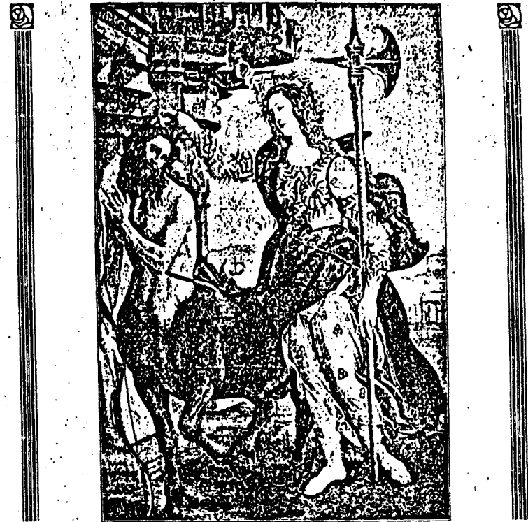
Abb. 1: Minerva, einen Stentauren händigend, von Sandro Botticelli. Das berühmte im Palazzo Pitti (Florenz) aufbewahrte Gemälde ist von tiefer aristokratischer Symbolik. So wie die antiken Dichter Minerva geschildert, so schwebt von unendlichem Liebreiz und göttlicher Würde umflossen, über blumige Wiesen die „etwig jungfräuliche, bellidenäugige, rosenwangige, purpurlippige, schwanenbusige Zeusochter“, um den in das Wehge arischer Gesittung eingebrochenen Tiermenschen zu züchtigen. Als die Hüterin ritterlicher Kriegsformen trägt sie die Hellebarde, als die Schutzgöttin des Friedens, aller Wissenschaft, Kunst und Kultur schmückt sie ihren Leib mit Zweigen von langen Goldbronzeloden umwante Haupt und die lilien-schlanken Glieder.