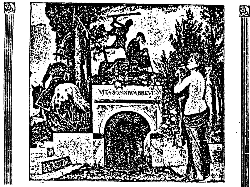
1866. 2: „Vita somnium breve“ (obere Hälfte des berühmten Gemäldes von Arnold Böcklin.)