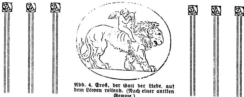
Abb. 4. Groß, der Gott der Liebe, auf dem Löwen reitend. (Nach einer antiken Gemme.)