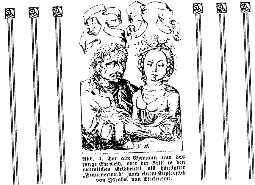
Abb. 3. Der alte Ehemann und das junge Ehemwib, oder der Griff in den männlichen Geldbeutel als häufiger „Frauenerwerb“ (nach einem Kupferstich von Israhel van Meckenem).

Seit jeher schon gab es Weinbüter, Schafsbüter und Schweinebüter, doch seit den Zeiten des Liberalismus und der Pöbel- und Weiberherrschaft gibt es auch „Hüter“ und „Hüterinnen“ der Sittlichkeit, die ihre Schnüffelnasen fortwährend nach „Unsittlichkeiten“ herumgehen lassen. Dabei treten sie wacker in Wort und Tat für freie Liebe ein, so daß man wohl auch heutzutage mit der Herzogin Viselott sagen kann: „Ich bin sehr Ew. Liebden meinung, daß die Lorbeerkrone besser siehet, als diejenige, womit die meisten weiber hir im landt ihre Männer crönen.“ Freie Liebe und Hütereie der Sittlichkeit, wie reimt sich das zusammen? Wenn es auf mich ankäme, sollte jedes Löpfchen sein Deckelchen haben und viel Hammer und Glend wäre aus der Welt geschafft. Ich habe meine toleranten rassenphysiologisch begründeten Anschauungen an anderen Orten dargelegt, so daß ich nicht zu besüßchten brauche, in den Verdacht eines Sittlichkeitsapostels und moralischen Splitterrichters zu kommen. Ich will hier nur darlegen, in welsch urdrollige Situationen jene „aschamigen“ Prophetinnen kommen, die beim Manne alle „Unsittlichkeit“ mit solch blindwütendem Fanatismus bekämpfen, daß sie völlig übersehen, wie sie selbst im „tiefsten Sumpf“ drinstecken. Am Februar 1909 brachten die „Münchener Neuesten Nachrichten“ ein Schreiben aus Graz, in welchem es heißt: „In der Zeitschrift „Hochland“ hat der Germanist unserer Universtität, Hofrat Schönbach, eine Kritik