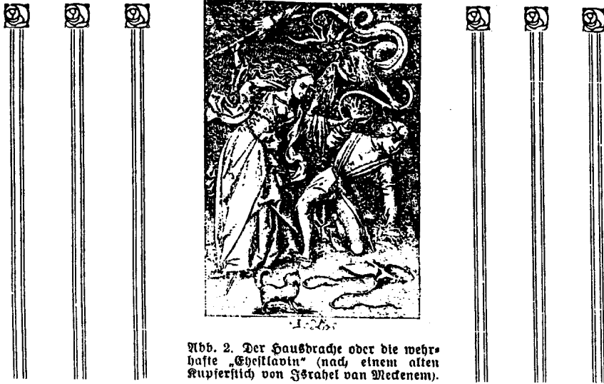
Abb. 2. Der Hausbrache oder die mehr- haste „Eheskavin“ (nach einem alten Kupferstich von Israhel van Meckenem).

unfähig wenig leisten, aber so enorme Summen von Volksvermögen und schwerer Männerarbeit leichtsinnig vergeuden. Die „erwerbende“ Frau ist ein guter, den Männern aber sehr teuer zu stehen kommender Witz!