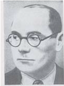
Ginsburg Volkskommissar für Bauwesen 1939—1941