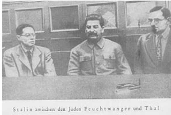
Stalin zwischen den Juden Feuchtwanger und Thal