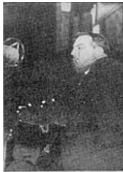
La Guardia La Gaurdia