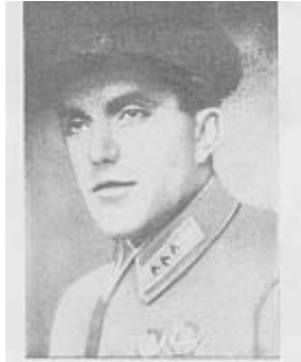
Smuschkewitsch, stellvert. Chef der Luftwaffe