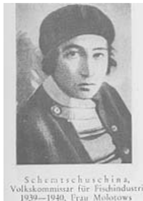
Schemtschuschina, Volkskommissar für Fischindustrie 1939-1940, Präf. Molotows