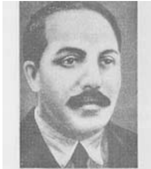
Julius Mosesohn Kaganowitsch