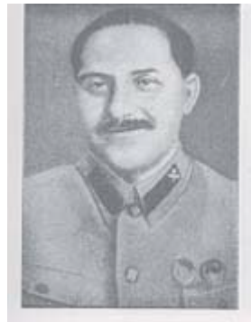
Lazarus Mosesohn Kaganowitsch