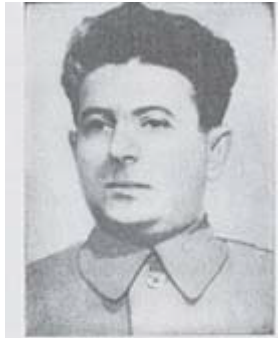
Mechlis, politischer Chef der Roten Armee 1937—1940