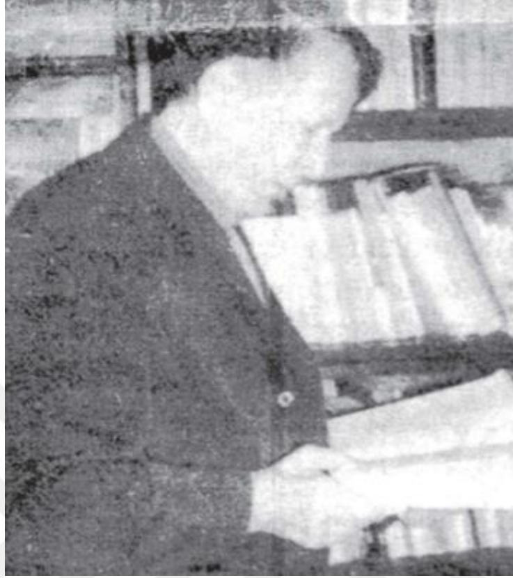
Resim 9: Atsız kütüphanesinde çalışırken