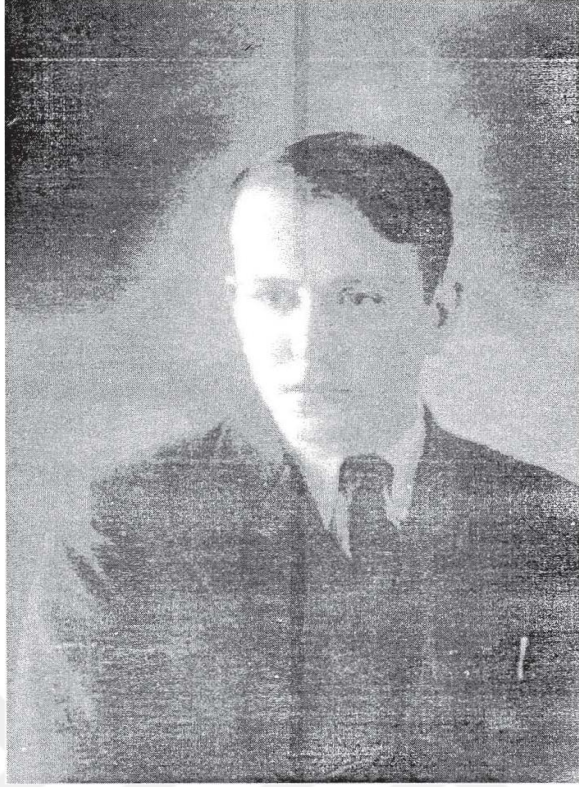
Resim 5: 1933 Edirne