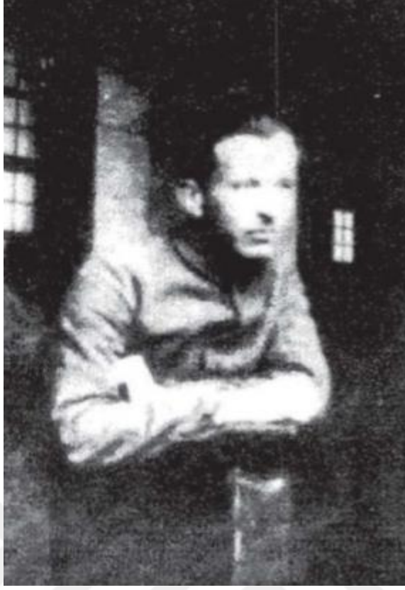
Resim 3: Askeri Tıbbiye yılları