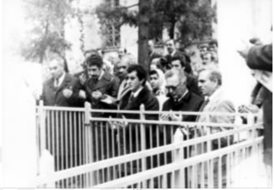
Resim 10: Hüseyin Nihal Atsız ve Kardeşi Necdet Sançar