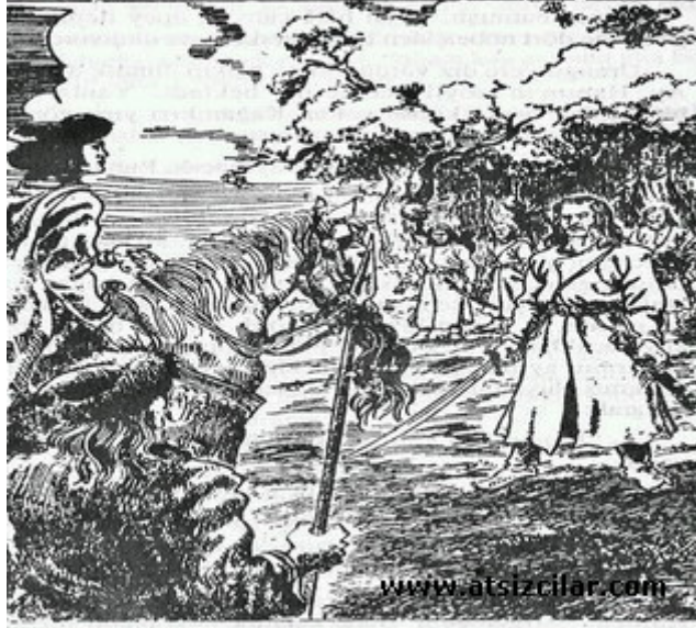
Genç ve güzel bir kız atın üzerinden kendisini süzüyordu.

Urungu o anda çevresini gördü. İyi giyimli, yavuz duruşlu bahadırlar kendisine bakıyorlar, genç ve çok güzel bir kız da atının üstünden kendisini süzüyordu. Urungu bunu tanıyordu. Fakat birdenbire nereden tanıdığını kestirememişti. Biraz önce çarpıştığı yüzbaşının yere diz vurduğunu görüp de ay Hanım adını işitince bunun arı soylu bir kız olduğunu anlamıştı. Fakat beyni karmakarışıklı. Binbaşıya bakarak: