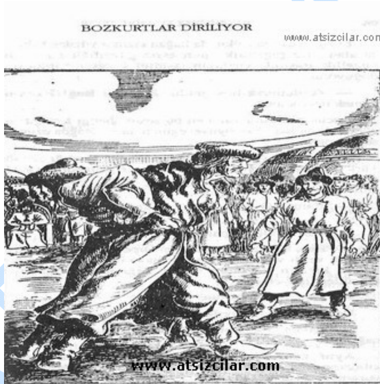
Göz yumup açacak kadar kısa bir anda kollarını birbirine taktılar. Bu görülmemiş bir gürleşti.

Sonra Çalkara olduğu yerde dönerek Buluç'u savurdu ve kendisini de onunla birlikte yere attı. Sarmaşdolaş bir halde yere düştükten sonra sırt sırta gelerek birbirinin sağ kolu sol koluna geçmiş olduğu halde davranıp hızla ayağa kalktılar. Göz yumup açacak kadar kısa bir anda öteki kollarını da birbirine taktılar. Bu görülmemiş işitilmemiş bir gürleşti. Ayakta, sırt sırta , kolları takılmış olduğu halde birbirlerini sırtlayıp yere vurmaya çalışıyorlardı. Bu didişme daha uzun boylu olan Çalkara'nın işine yaradı ve kendisi yere doğru iki büklüm olurken havaya kaldırdığı rakibini sert bir silkinişle kolundan çıkararak yere vurdu.