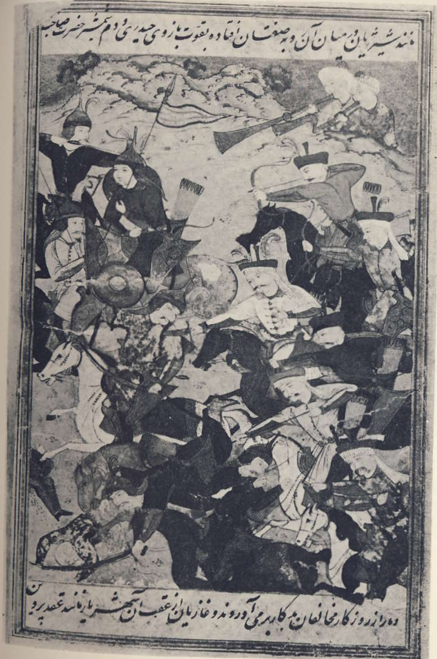
Şah İsmail'in Ak-koyunlu Elvend Mirza'yı yenmesi

37 Hattâ bunların ileri gelenlerinden bazıları maiyetleri ile birlikte — bu sırada tebrîk'e gelmiş olan — Osmanlı elçisine göz dağı vermek için bizzat onun önünde yakıldılar (AT, 113 a ; HD, s. 41). Tebriz'de Şeyh Haydar ile yapılan savaşa katılmış olanlar araştırılıp hepsi katledildiler. Katliâmlar daha sonra fethedilen Horasan'da da icra edildi. İsmail'in yaptığı katliâmlar hakkında bir çok misaller için şu eserlere bak: YK, s. 244, 246, 247, 249, 250; GAF, s. 269; HD, s. 39 - 41, 75; HR, s. 79, 80, 85, 88, 138, 139; Kemal Paşa Zâde, 30 a - 32 a ; Münecim Baş, Sahâyifü'l-ahbâr, İstanbul, 1285, III, s. 182 - 183, 184, 185, 187. Angiolello, İsmail'in Tebriz'e girdiğinde din adamları, kadınlar ve çocuklar da dahil olmak üzere pek çok insan öldürdüğünü, savaşta ve Tebriz'de yirmi bin kişiden fazla insanın telef olduğunu söylemekte ve hattâ anasının bile hayatına son verdiğini yazmaktadır. (A Narrative of Italian travels, s. 105 ve ayrıca 190 ve 191 inci sahifelere de bak.). Kemal Paşa Zâde de Şah İsmail'in Tebriz'de Ak Koyunlu oymağından kırk elli bin kişiyi kılıçdan geçirdiğini ve kendisini fena itikad ve zulümden menetmeye çalışan anasına kızıp onu öldürdüğünü söyleyerek Angiolello'yu teyideder (30 a -b). Şah İsmail'in yaptığı katliâmlar ile ilgili olarak şu makaleye de bak: J. Aubin, Şah İsmail et les notables de l'Iraq Persan, journal of economic and social history of the Orient, II, 1, s. 37 - 81, bilhassa s. 57 - 60.