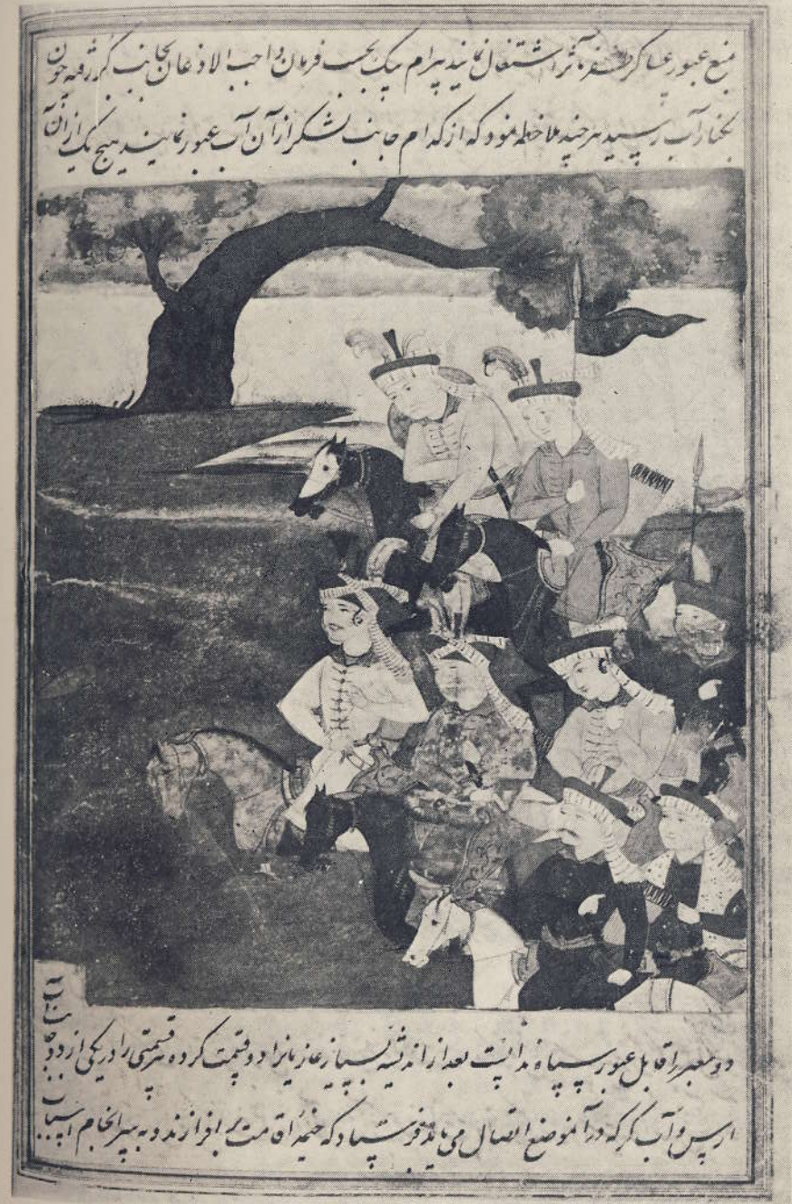
Safevî ordusunun Kür ırmağını geçişi