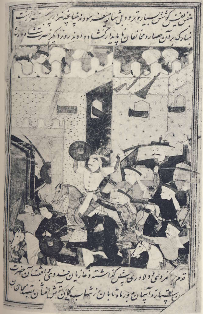
Şah İsmail'in bir hisara hücumu