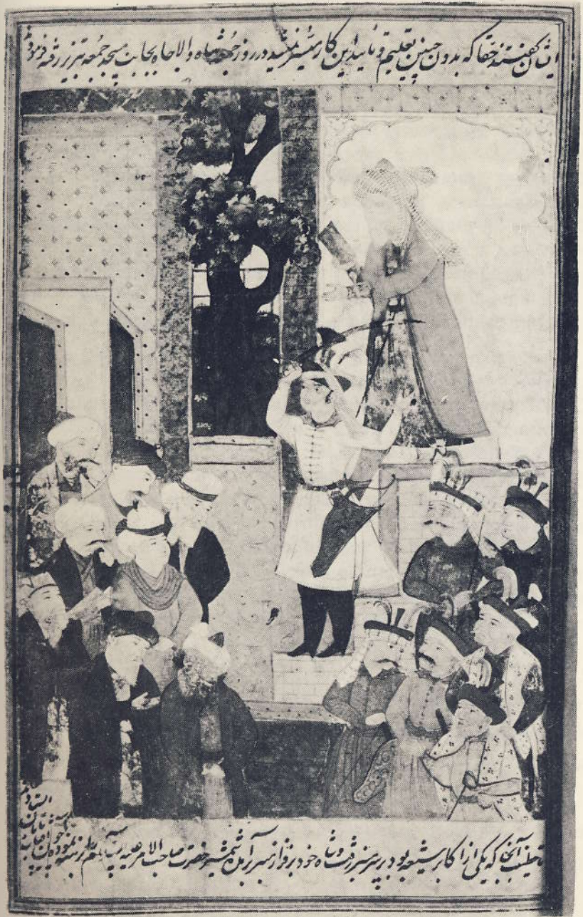
Şah İsmail adına Tebriz'de hutbe okunması