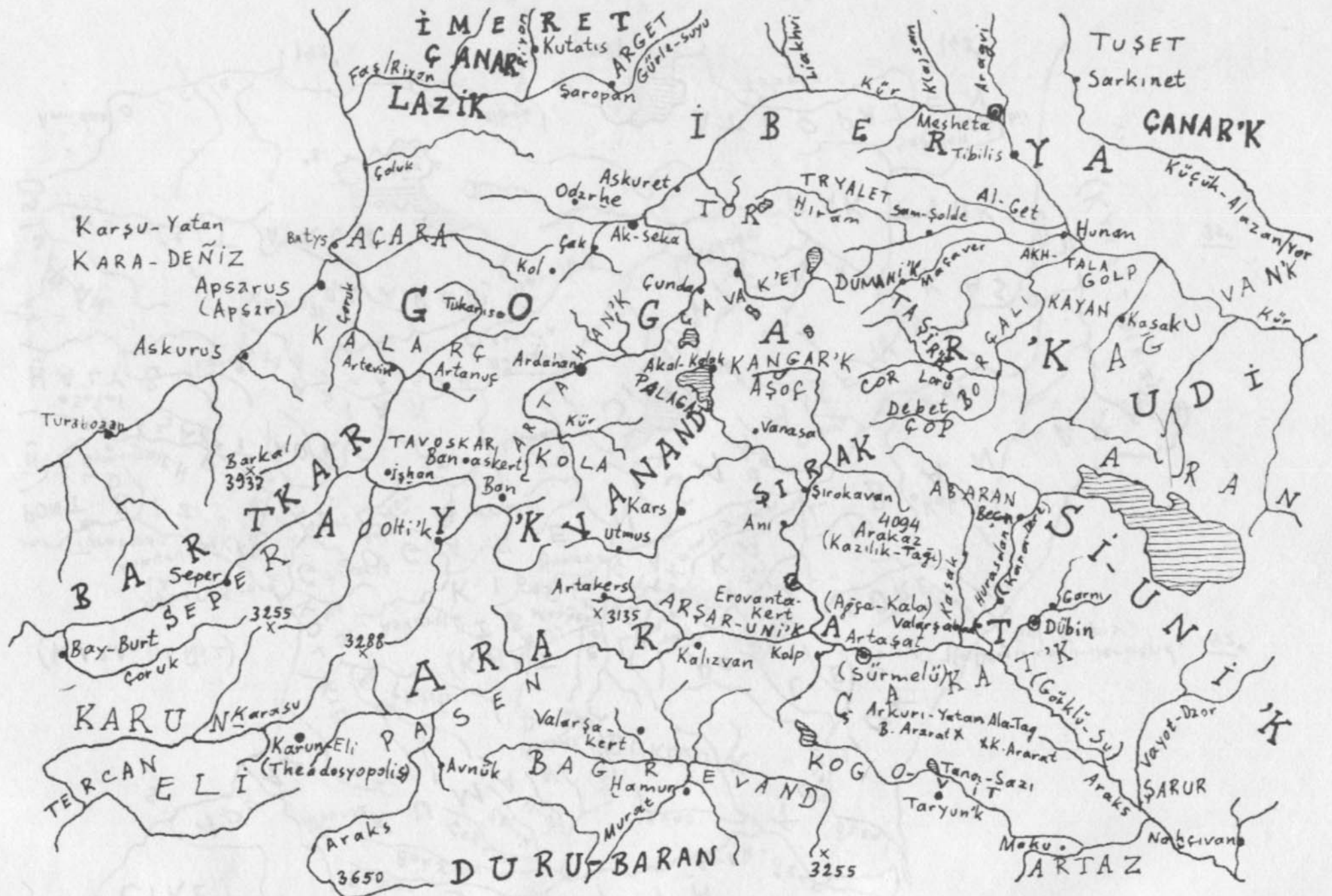
2. HARİTA M.Ö. 200-M.S. 430 yılları