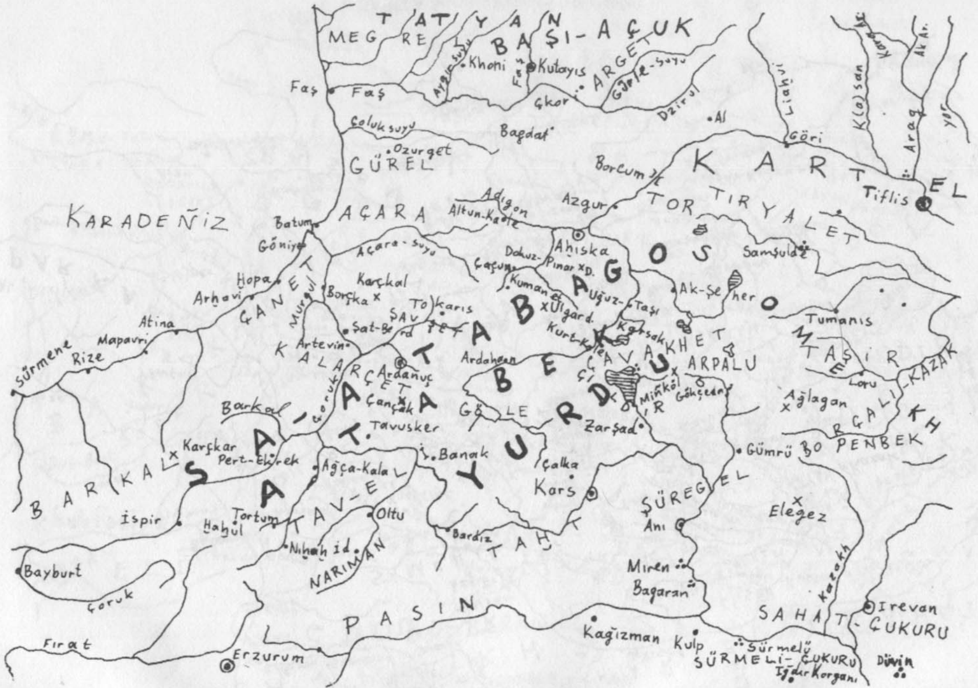
4 HARİTA Kıpçaklı-Atabekler Yurdu/Sa-Atabago (1267-1578)