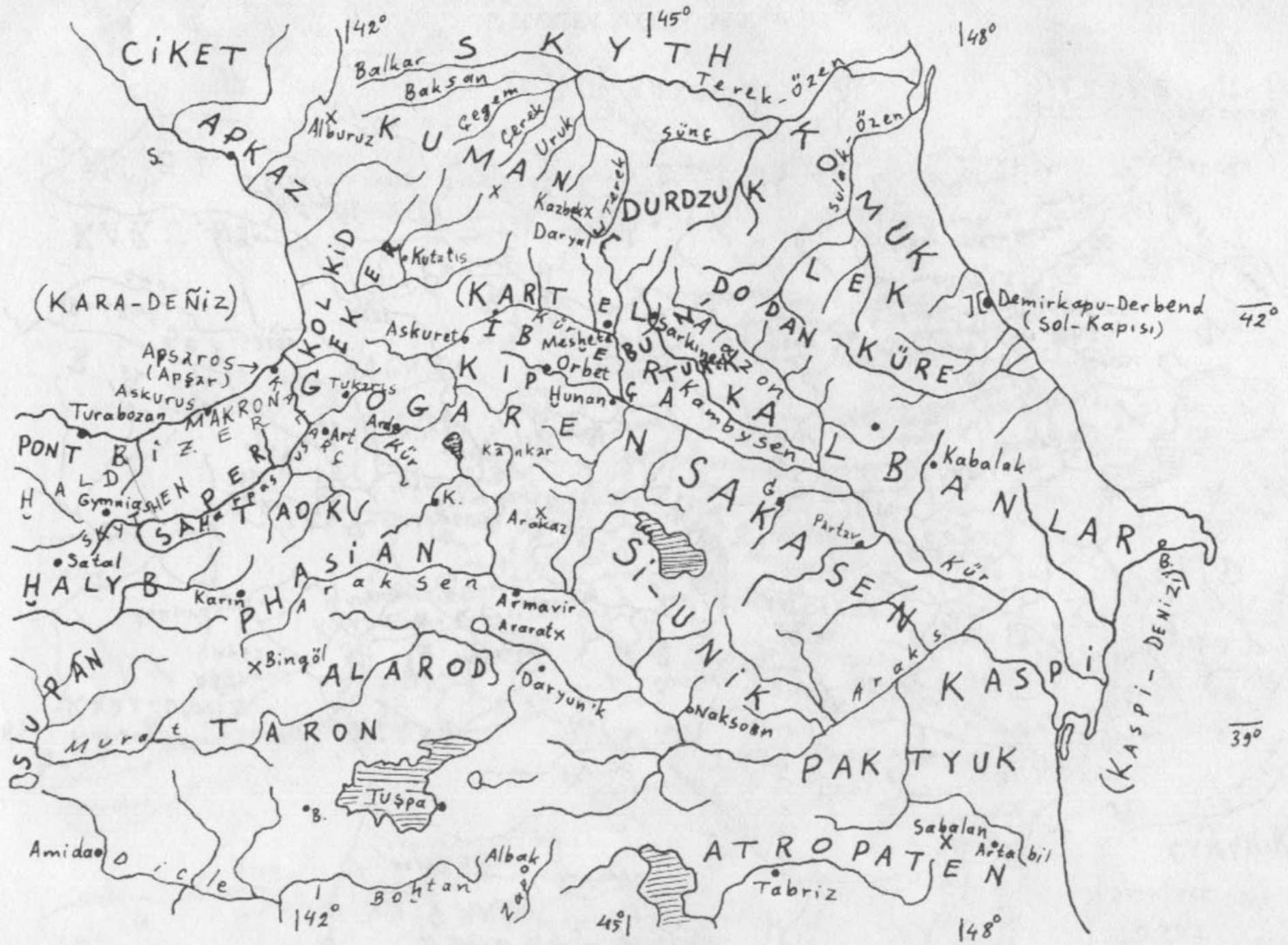
1. HARİTA M.Ö. 700-200 yılları Majüsküller BÖLGE adlarıdır.