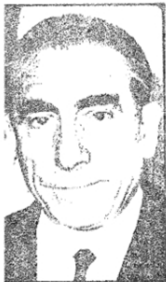
Kapak Düzeni: Selim Yağmur

Türkiye'de bugün dahi Batılı mânâda siyasî partilerin varlığından bahsetmek güçtür. Bizde umûmiyetle sınıfsal temellere dayanmaktan çok siyasî - idarî - içtimai yapı bakımından farklı fikirlerin partileştiği görülmektedir. İttihat ve Terakki Fırkasından başlayarak gelişen bu değişik geleneğin bugün bazı sosyal gurupların menfaatlerini korumaya yönelmiş olduğu iddiaları yaygınlaşmaktadır. Dergâh yayımları, Türk siyasî hayatıyla ilgili doğruları sahip oldukları tavra bakmadan ortaya koymakla bu sahada sürüp giden kargaşalığı bir ölçüde gidermek gayesinde dir. Öncelikle günümüz siyasî parti liderlerinin fikirlerini yansıtan kitaplar yayımlanacak, zamanla Türkiye'de siyasî düşüncenin gelişimini açıklığa kavuşturan belge kitaplar ve araştırmalar okuyucularımıza sunulacaktır. Selâhiyetli bir heyet tarafından hazırlanan «Türk siyasî düşüncesi» dizisi, Türk siyasî hayatındaki eğilimlere açıklık getirmek gereğine dayanmaktadır.