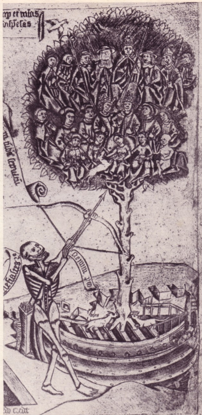
LEBENSBAUM AUS EINER ALTEN HANDSCHRIFT