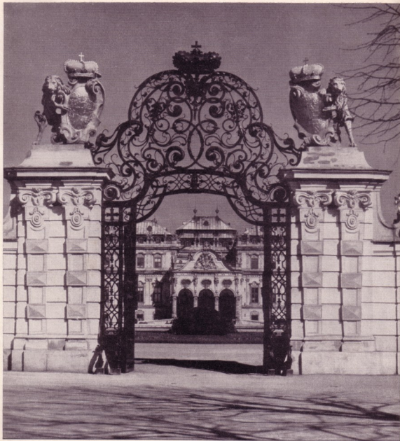
SCHLOSSEINFAHRT DES BELVEDERE

Unser Bildausschnitt zeigt die Schlosseinfahrt zum Belvedere, dem von Lukas von Hildebrandt und Fischer von Erlach 1693—1724 erbauten Lustschloß des Prinzen Eugen zu Wien. Der Savoyer, der es zeit seines Lebens verschmähte, sich in Selbstzeugnissen und Briefen dem Gedächtnis der Nachwelt zu empfehlen, hat sich in seinem Belvedere ein Denkmal gesetzt, das in beredter Stummheit von der schlichten Größe dieses Mannes zeugt. Was ein Zeitgenosse von dem Prinzen gesagt hat, darf auch für dieses Meisterwerk des deutschen Barocks gelten: „Niemaß habe ich so viel Größe mit so viel Einfachheit verbunden gesehen.“ Deutsche Zucht und östliche Weite sind in diesem Bauwerk zu vollendeter Harmonie vereint, das an der Schwelle der ungarischen Tiefebene von der unvergänglichen Sendung des Reiches im Südosten kündigt.