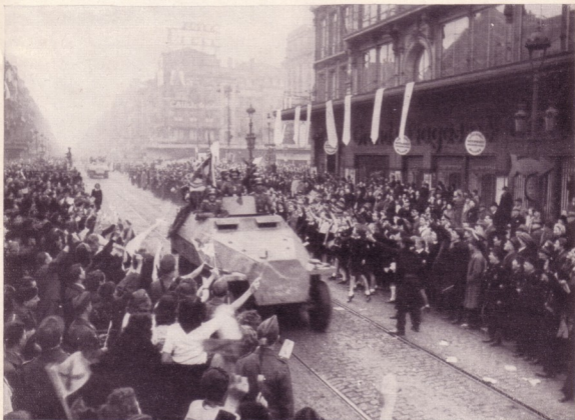
UNTER BRAUSENDEM JUBEL ZIEHT DIE ff -FREIWILLIGENBRIGADE IN DIE STADT EIN

Nach schweren Kämpfen im Osten kehrten die Männer der ff -Freiwilligen-Brigade „Wallonien“, die unter ihrem Führer, Ritterkreuzträger ff -Sturmbannführer Degrelle, in den Kämpfen um den Kessel von Tscherkassy neuen Ruhm an ihre Fahnen hefteten, zu einem Sonderurlaub in ihre Heimat zurück. Aus allen Teilen des Landes war die Bevölkerung herbeigeeilt, um die tapferen Söhne zu empfangen. Auch ff -Obergruppenführer Sepp Dietrich, Träger des Eichenlaubes mit Schwertern zum Ritterkreuz, war zu ihrer Begrüßung erschienen.