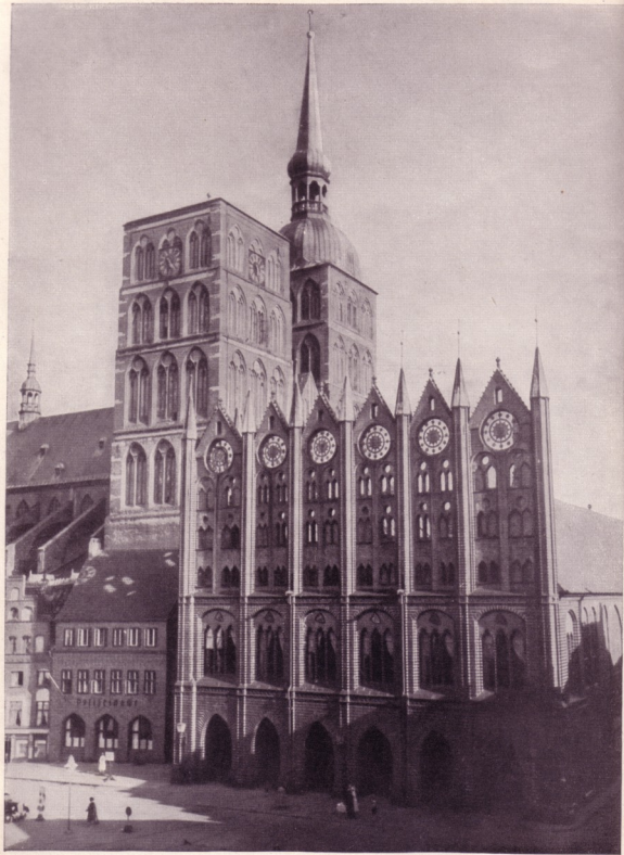
STRALSUND. RATHAUS UND NIKOLAIKIRCHE