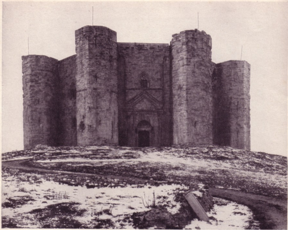
CASTEL DEL MONTE IN APULIEN

Die schönsten und gewaltigsten Wehrdenkmäler der deutschen Kaiserzeit wurden unter den Staufern, besonders unter Friedrich II., geschaffen. Sie sind sichtbare Zeichen europäischer Machtentfaltung und Machtgestaltung. Friedrich II. war einer der größten Baumeister des Mittelalters. Auf die architektonische Gestaltung seiner Burgen hatte er maßgebenden Einfluß. Seine genialen Konstruktionen, die die achteckige Burgform bevorzugten, blieben auch dann noch