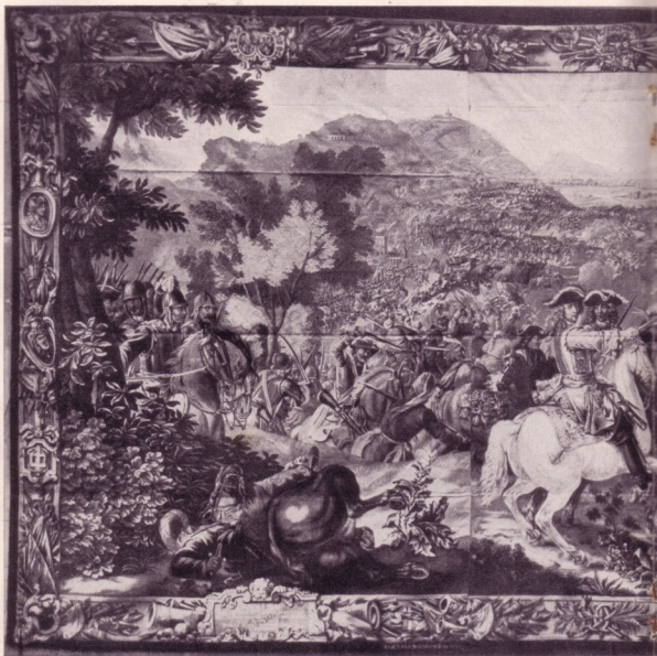
DIE SCHLACHT AM KAHLENBERG BEI WIEN (12. SEPTEMBER 1683)

Dieses zeitgenössische Bild stellt die Befreiungsschlacht am Kahlenberg bei Wien (12. September 1683) dar. — Die Türken Schlacht bei Wien zählt zu den großen weltgeschichtlichen Ereignissen, welche das Gesicht der Welt für Jahrhunderte bestimmen. Deutsche Truppen, vereint mit Freiwilligen aus dem Osten, aus Frankreich und fast allen europäischen Ländern, errangen einen glänzenden Abwehrsieg gegen die unermesslichen Scharen des Großherrn, der hier die geballte Macht seines vorderasiatisch-balkanischen Reiches eingesetzt hatte, um das Tor nach Mitteleuropa aufzusprengen. Fiel Wien in die Hand der Türken, so lagen Deutschland und