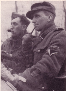
Bild unten: DER HAUPTKAMPF, DER DAS LETZTE VON JEDEM FF -MANN FÜRDERTE, IST ÜBERSTANDEN

Bild rechts: JETZT GEHT ES INS VERDIENTE RUHEQUARTIER