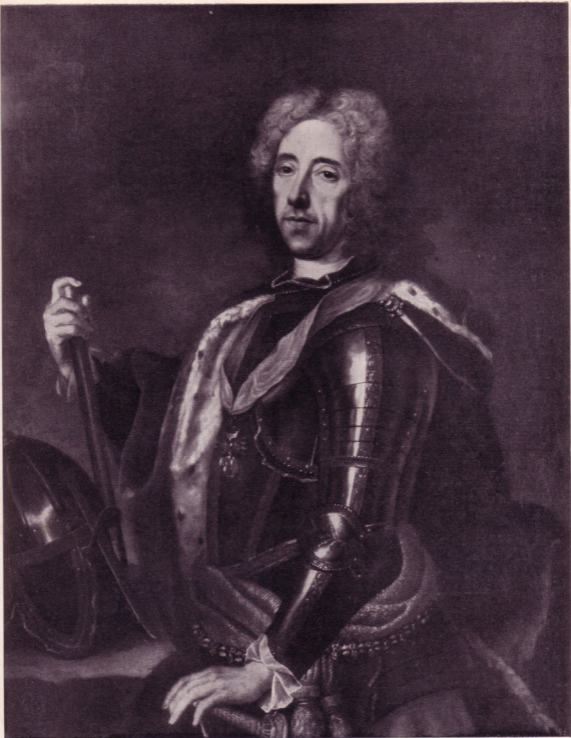
PRINZ EUGEN / NACH EINEM GEMALDE VON KUPETZKY