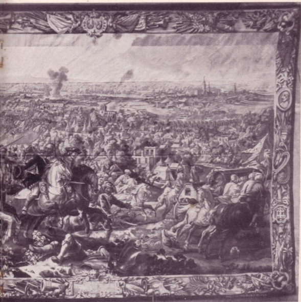
SEPTEMBER 1683) NACH EINEM ZEITGENÜSSISCHEN GOBELIN

Italien offen vor dem Zugriff des Halbmondes. Neun Wochen lang hielt Wien dem Ansturm der türkischen Übermacht stand, bis in der ersten Hälfte des Septembers das Entsatzheer herannahte und die heldenmütigen Verteidiger befreite. Prinz Eugen gehörte an der Spitze seiner Dragoner mit zu den ersten, welche die dichten türkischen Massen zusammenhieben und sich bis zu den Toren der Stadt durchschlugen. Die schneidige Tapferkeit des 20jährigen Savoyers wurde mit dem Kommando eines Reiterregiments belohnt, das bis zum Weltkrieg den Namen des Helden fortführte.