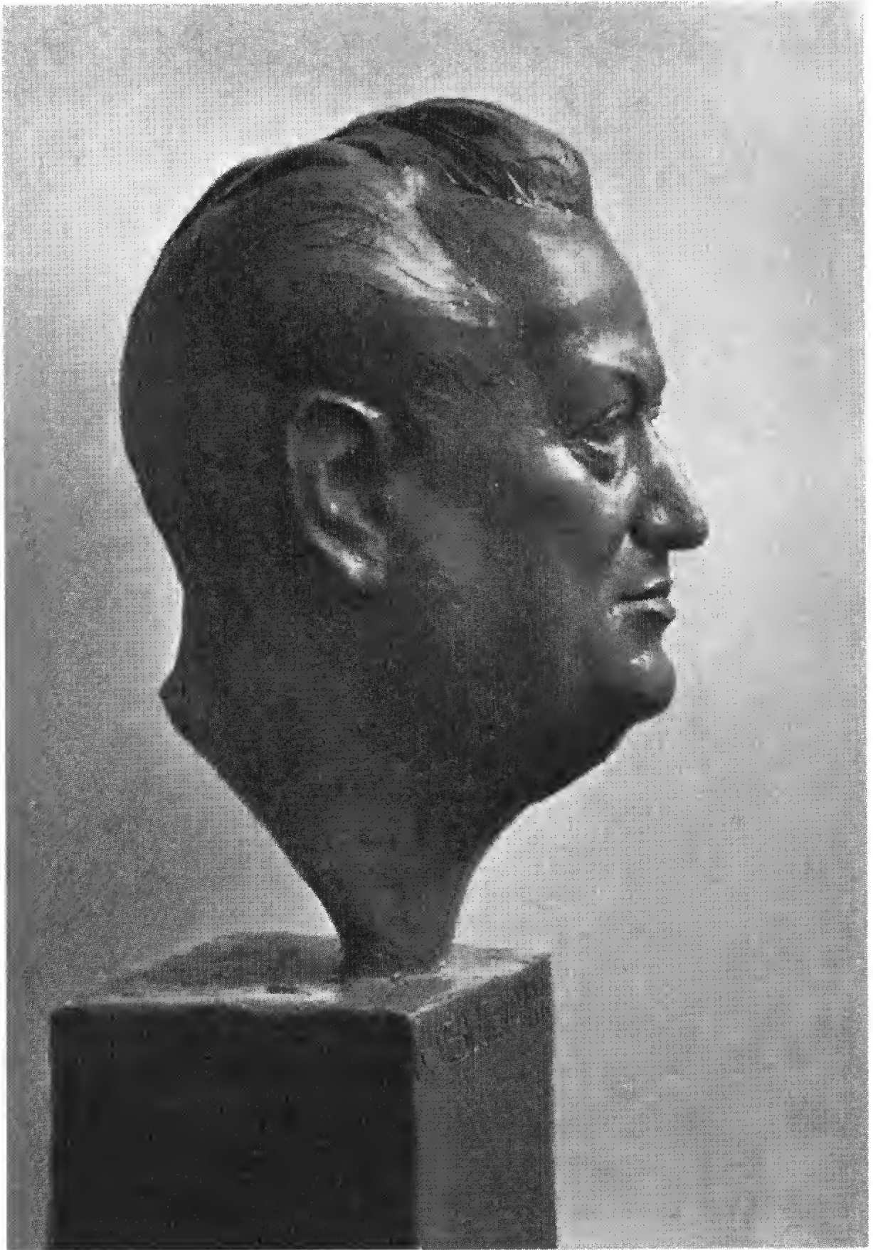
Rudolf von Sebottendorff, Gründer der Thule Gesellschaft, Orden für Deutsche Art