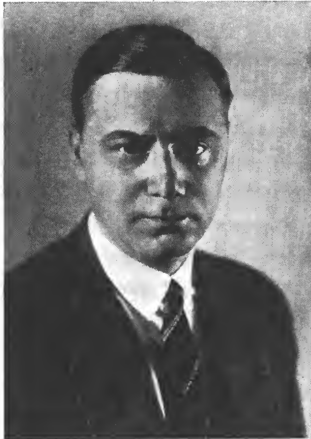
Alfred Rosenberg, Mitarbeiter Eckarts