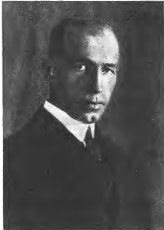
Diplom-Ingenieur Gottfried Feder