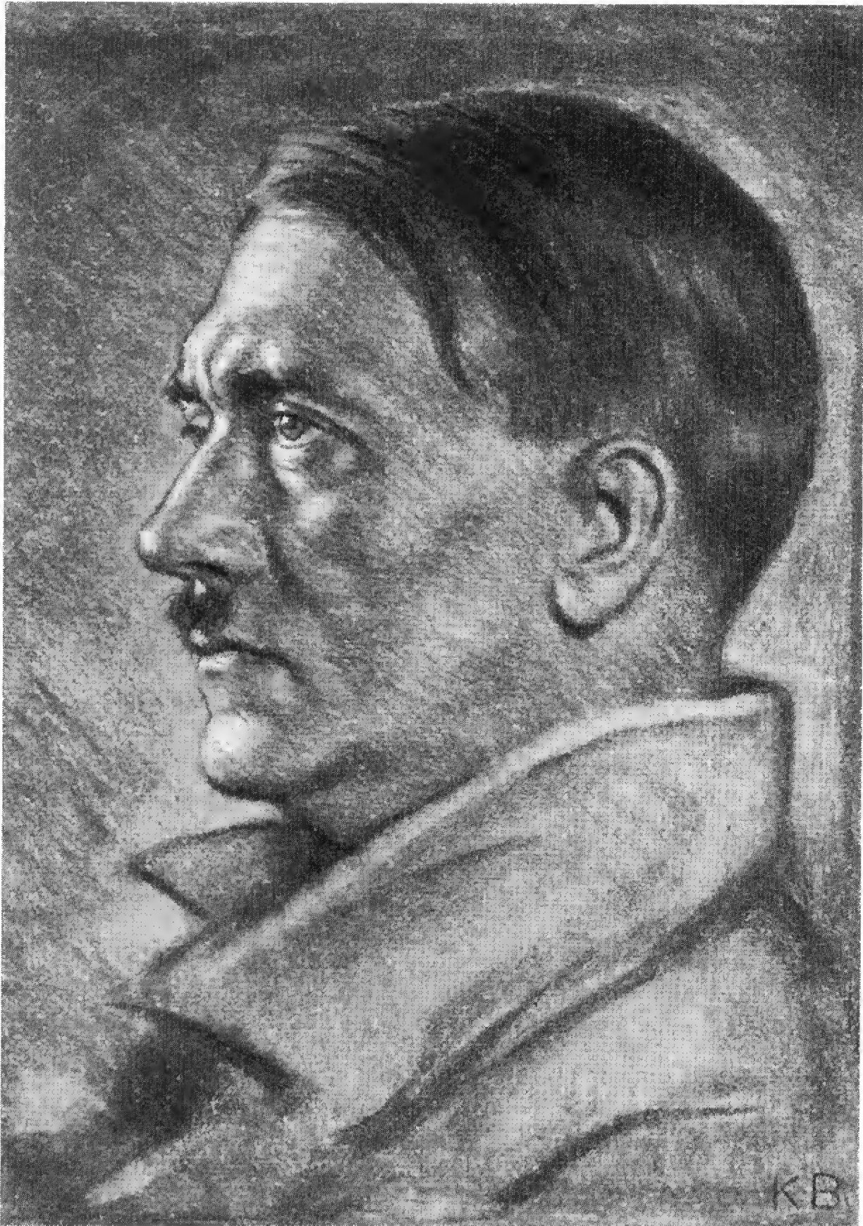
Adolf Hitler, Kanzler des Deutschen Volkes, Führer der nationalsozialistischen Bewegung