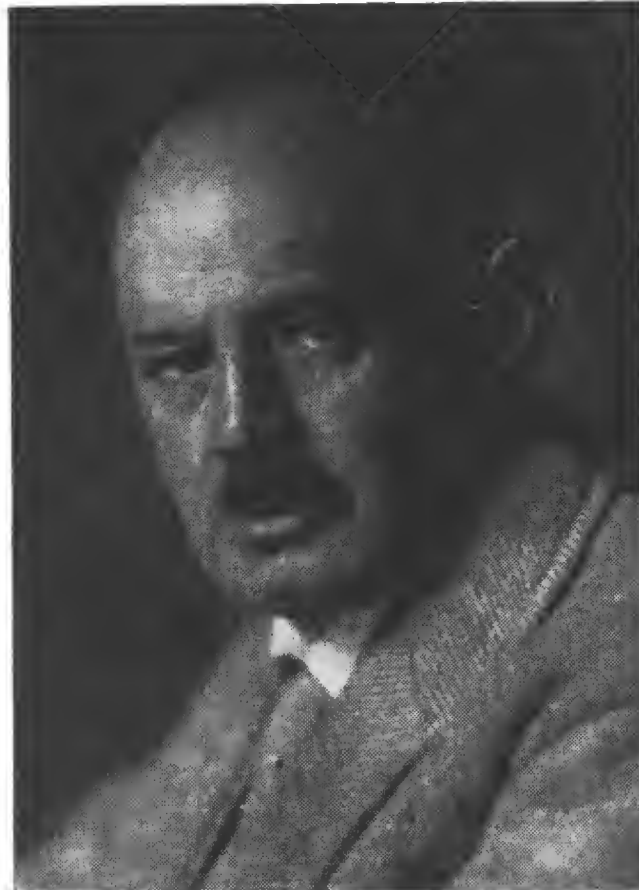
Deutscher Freiheits-Dichter Dietrich Eckart †

Unter den Rassen der Erde ist die germanische Rasse kraft ihrer Anlage zu dieser Führerstelle berufen. Soweit das Auge zurückschaut in die Vergangenheit, immer sind die Träger germanischen Blutes auch die Träger, die Schöpfer einer Kultur gewesen.