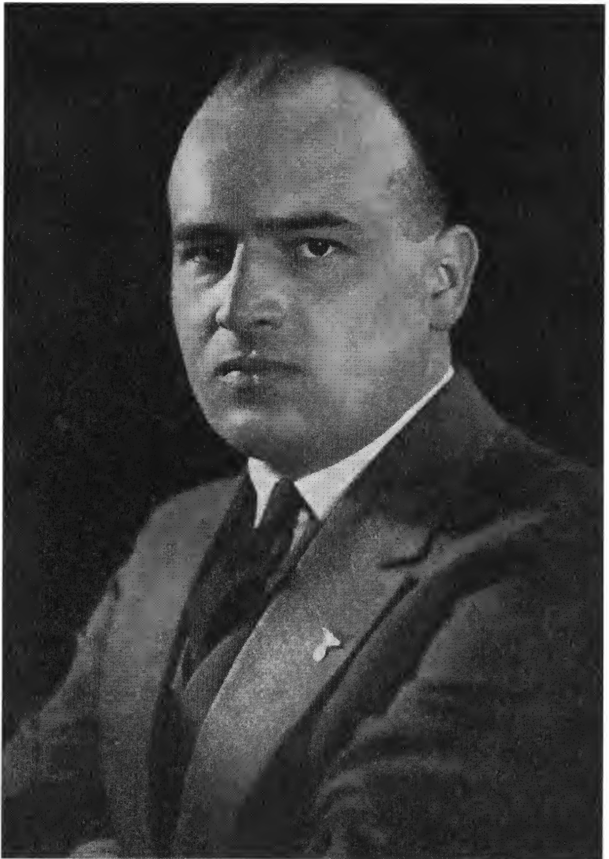
Dr. Hans Frank, Bayer. Staatsminister der Justiz und Reichskommissar der Justiz