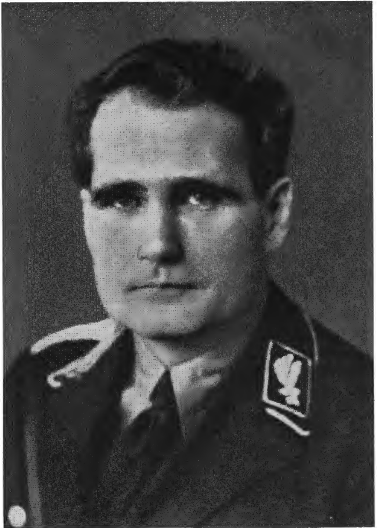
Rudolf Hess, Stellvertreter des Führers mit ausübender Gewalt in der N.S.D.A.P.