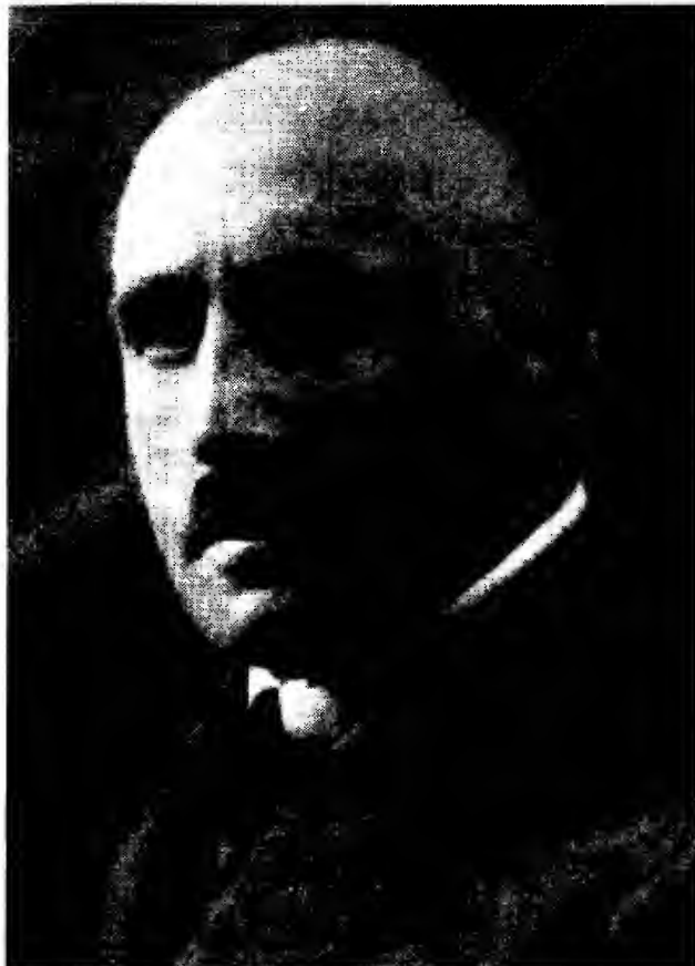
Julius Streicher, Vorkämpfer der Bewegung

„Jeden, der sich der ‚dialektischen Begabung und Überredungskunst‘ des Juden gewachsen zeigt; jeden, der den Verführungskünsten des jüdisch=materialistischen Wohllebens siegreich widersteht; jeden, der sich