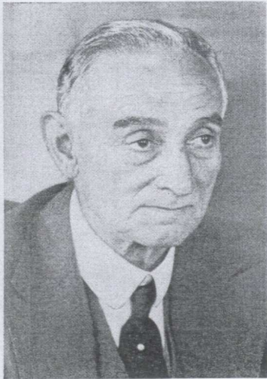
Lord Reading (Isaac Rufus) †