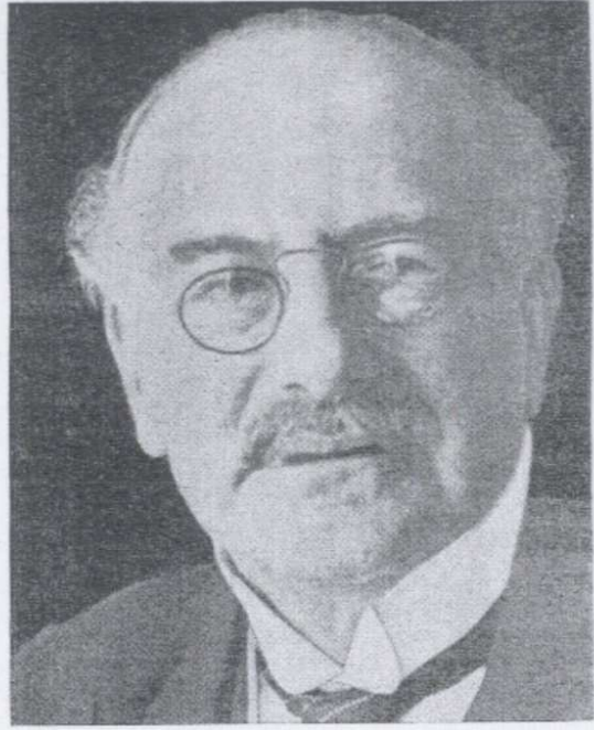
Lord Melchett (Alfred Mond)