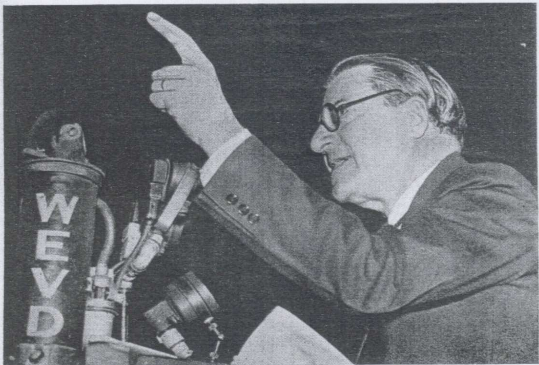
Stephen S. Wise, Leiter des „American Jewish Congress“