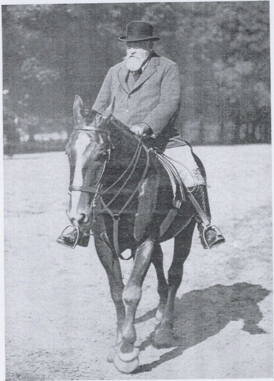
Lord Walter Rothschild †