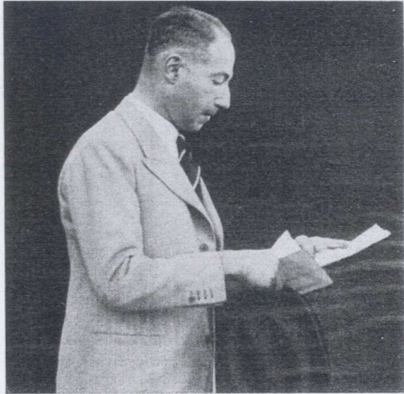
Sir Philip Casson, First Commissioner of Works