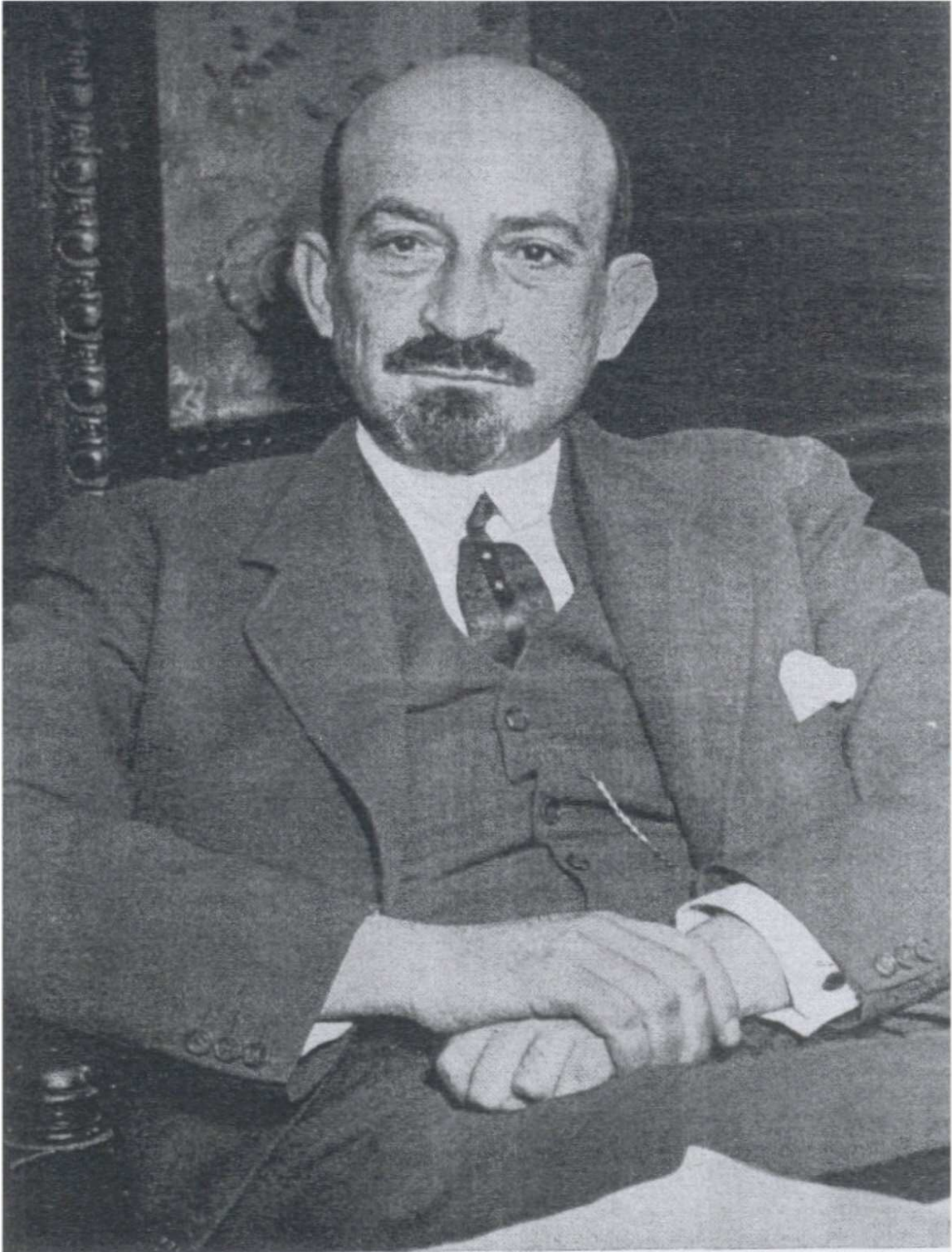
Chaim Weizmann Leiter der „Jewish Agency“ und der Zionistischen Weltorganisation