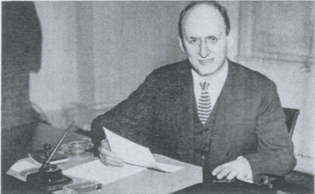
Juda Henry Morgenthau jun., Schatzamtssekretär der USA.