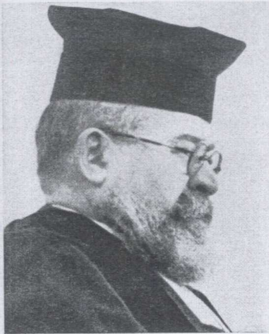
Der Großrabbiner von England J. H. Herz