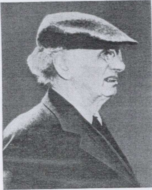
Louis D. Brandeis