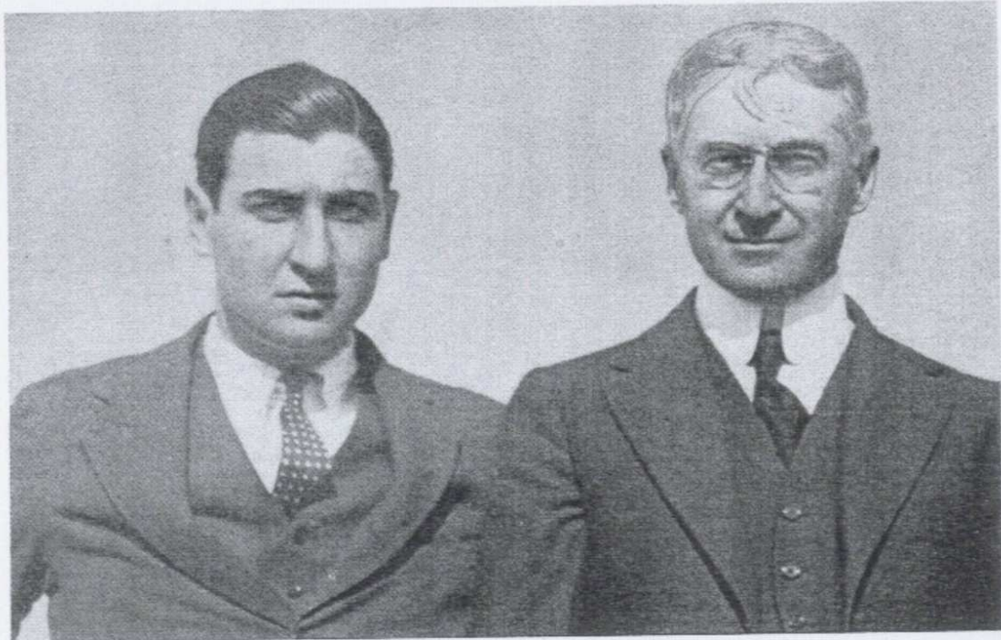
B. M. Baruch, ständiger Finanzberater Roosevelts und sein Sohn