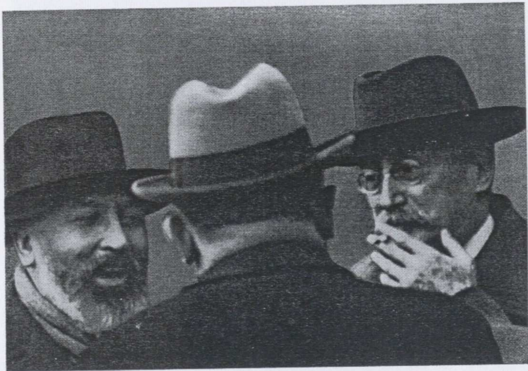
Mary, Dormoy und Léon Blum