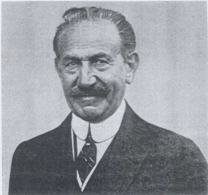
Samuel Untermeyer, Leiter der „Non Sectarian Anti-Nazi-League“