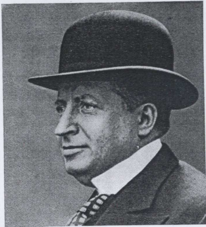
Georges Mandel, franz. Kolonialminister