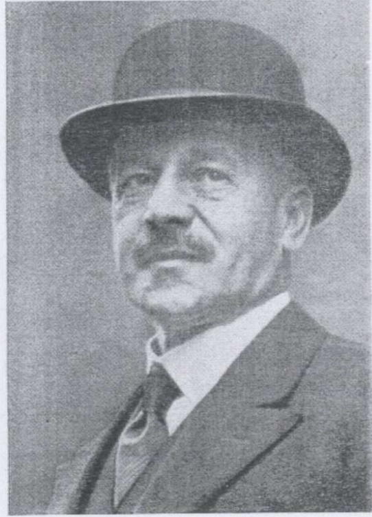
Lord Samuel of Mount Carmel