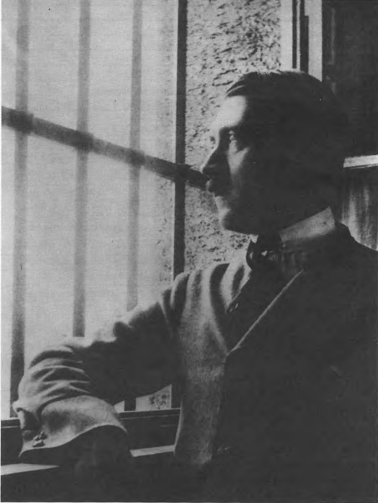
Adolf Hitler en la prisión de Landsberg, 1924.