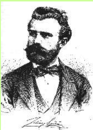
Istóczy Győző (1842-1915.)

Egy zsidó ízű, zsidó színű álmagyar kultúra virágzik itt ki olyan sűrű áthatolhatatlan tenyészetben, hogy az igazi a tiszta, magyar szellemiség lassan másodrendű szerephez juthat csupán. Nagyjából ilyen volt a helyzet Magyarországon a múlt század 80-as éveiben, amikor a magyar politikai antiszemitizmus és a magyar fajvédelem első képviselője megindította a küzdelmet a magyarság létérdekeiért.