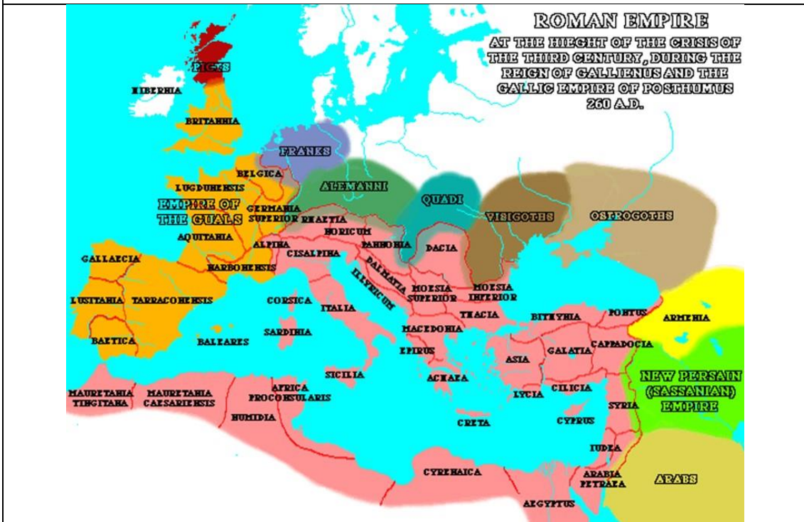
IMPERIUM ROMANUM. 100 BC-1453 AC

FINIS OPERIS. FUNDAMENTA GEOPOLITICAE ALEXANDER DUGIN AUCTORE