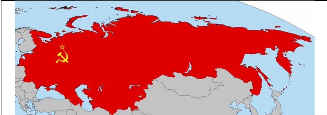
THE SOVIET EMPIRE. 1917-1989