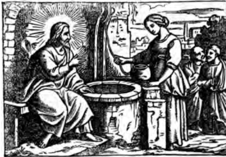
(Johs. 4, 23. 24.)