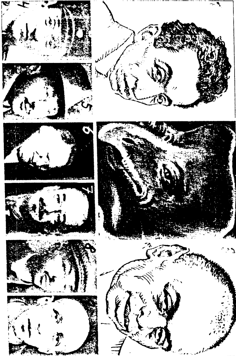
Die Goldstücke 1, 2, 3, 4, 5, 6, 7, 8, 9, 10, 11, 12, 13, die Rückseite der ungarischen Proleten-Diktatur, 2, 1930. (Unverlangte Rezensionen werden nicht besprochen und nicht zurückgeschickt.)

Der Traumspiegel. Von Dr. med. Georg Lörner, Verlag J. Neumann, München, 1930. M. 1.20.—