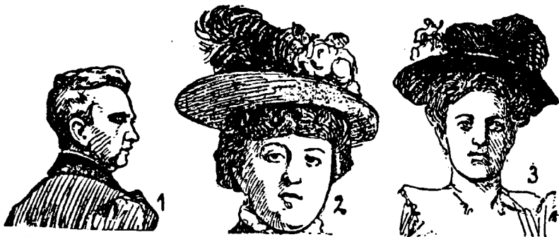
Abb. 1. Eine Gallenmörderin: männliche Gesichtsbildung, männlich auch in der Frisur und Kleidung. Abb. 2. Eine Raubmörderin: dunkler mongoloide Mischlingstypus, mongolischer Augenschnitt, kleine Stulpnase, rundes Gesicht, höchst gefährlicher intelligenter erpresserischer Weiberthypus. 3. Das Opfer der in Abb. 2 dargestellten Raubmörderin: eine langgesichtige Blondine, mit hellen Augen, langer, steiler, schmaler Nase. Man vergleiche diese Abbildung als wirksames Gegenstück zu den in Abb. 1, 2, 4-6 dargestellten Typen.

gleich wieder das Amt des Surenweibels einführen und die Gebanmen mit mobilisieren.