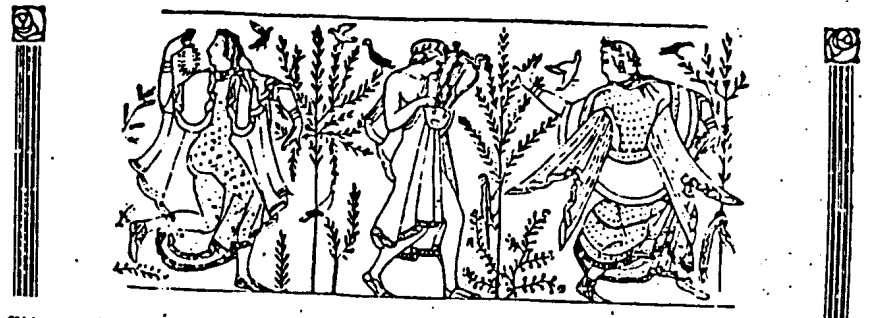
Abb. 2. Zeit der beglückenden Kleiderkultur und Weiberkultur, darstellend ein attetruskisches Wandgemälde. Das Profil der linken Tänzerin deutet auf mittelländischen Einschlag hin, die Etrusker waren ein herold mediterranes Mischvolk von großer Sinnlichkeit. Gerade dieses Gemälde zeigt besonders deutlich, daß die Kleidung ursprünglich nicht praktische Notwendigkeit, sondern nur Körper Schmuck zur Steigerung der Erotik war. Denn die Gewebe sind durchsichtig und lassen die Körper der Tänzerinnen, die den Mann sofort umschwärmen (Kennzeichen der Weiberkultur), nur zu deutlich sehen.

Standbilder verehigt. Von einem sonderbaren Gebrauch, der offenbar auf eine ausgebildete Nacktkultur zurückgeht, erzählt Tacitus. 1 Jünglinge führen nackt Schwertkänze auf, nicht aus Absichten des Gewinnes oder Erwerbes, sondern lediglich zu ihrem eigenen Vergnügen, um ihre Körper geschmeidig zu machen, die Körperbewegung zu veredeln und den Zuschauern einen Augenschmaus zu bereiten. 2 Nackt zogen die alten Dorer in den Kampf (vgl. Abb. 1), halb nackt, wegen des rauhen Klimas, rückten die alten Germanen in die Schlacht aus (vgl. „Ostara“, Nr. 63, Abb. 2 und 3). Im Mittelalter war es nicht selten Gebrauch, daß fürstliche und hohe Gäste an der Stadtpforte von nackten „Ehrenjungfrauen“ empfangen wurden. 3