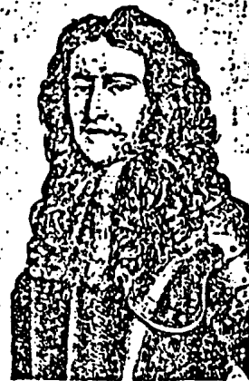
Abb. 4. König Wilhelm III. von England († 1702), nach einem Kupferstich von J. Houbraken. Seine weibliche Blige. Typus des sensiblen (passiven?) Urnings. Genialer Staatsmann, Begründer der englischen Weltmachstellung.