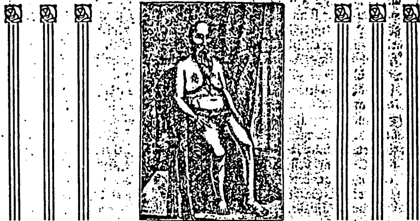
Abb. 1. Der moderne Hermaphrodit (Brotler) Maria Madeleine Lesort. Primäre Geschlechtsmerkmale und Brust weiblich, Gesicht mit dem starken Bartwuchs männlich.

Zuschriften, die beantwortet werden sollen, ist Rückporto beizulegen. Manuskripte höchst abgelehnt! Besuche können nur nach vorheriger schriftlicher Anmeldung empfangen werden. Damenbesuche, wenn auch in Herrenbegleitung, grundsätzlich abgelehnt!