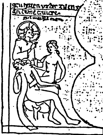
Abb. 3. Adam die Eva gebärend. Darstellung aus der Konstanzer Biblia pauperum als Beweis, daß auch noch im Mittelalter die Erinnerung an die hermaphroditische Grundnatur der Menschen lebendig war.

(Vgl. Dr. v. Römer: Die androgynische Idee des Lebens, Jahrbuch für sexuelle Zwischenstufen, V, Leipzig, 1908.)