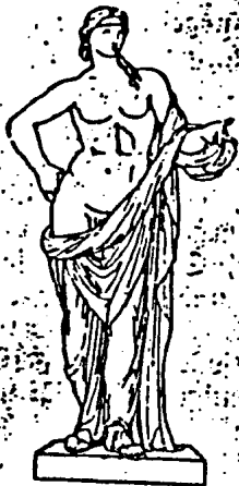
Abb. 2. Antiker Hermaphrodit (Prokter) aus der Sammlung Pompejill. Primäre Geschlechtsmerkmale männlich, Brust und Gesicht weiblich; gewöhnlich als androgynischer (mannweiblicher) Apoll angesehen.

(Vgl. Dr. v. Römer: Die androgynische Idee des Lebens, Jahrbuch für sexuelle Zwischenstufen, V, Leipzig, 1908.)