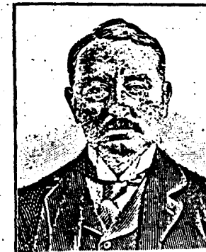
Abb. 5. Cecil Rhodes, Typus des Finanztalentes mediterran-heroider Mischung. Starke Entwicklung des „Cautal“.