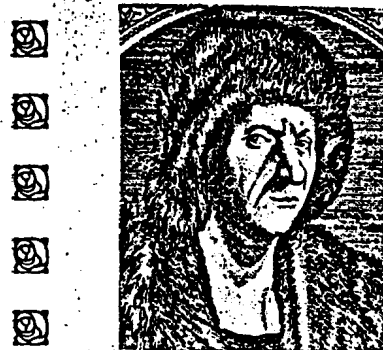
Abb. 1. Jakob Fugger der Ältere, Typus des gewöhnlichen Geld- machers, primitiv-mongoloider Typus: hohl liegende Augen, große Nase, Wangenfalte, primi- tives Kinn etc.

Um den Rassen-Schönheitspreis können sich bewerben alle Abon- nenten und Leser der „Ostara“ gegen Einsendung 10 solcher Ab- schnitte (deselben oder verschiedener Hefte) und einer genauen Photographie. Beurteilung und Zuverteilung erfolgt auf Grund der im Hefte 31 angegebenen Rassenwertigkeitsbestimmung. Auszahlung der Preise am 1. Jänner jeden Jahres.