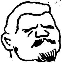
Abb. 7. Maurermeister, Schandwirt, Expresseur, Spindel-, Bürokraten- und Pädagogokraten-Typus gefährlichster Sorte. (Nach einer Zeichnung von E. Thöny aus „Sindligismus“ XIV, Nr. 46. Mit Erlaubnis des Verlegers A. Langen, München.)

Herausgeber und Schriftleiter, J. Lang-Liebenfels Rodaun-Wien.