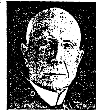
Abb. 6. John D. Rockefeller, Typus des wirklichen großen Finanzgenies heroischer Rasse. Enorme Entwicklung des „Firmital“.

Wir betrachten hier die Juden nicht vom Standpunkt der Konfession, sondern vom Standpunkt der Rassenkunde, wie dies bereits Napoleon I. getan hat, indem er meinte: „Man muß die Juden als Nation (Rasse), nicht als Sekte betrachten.“ 1