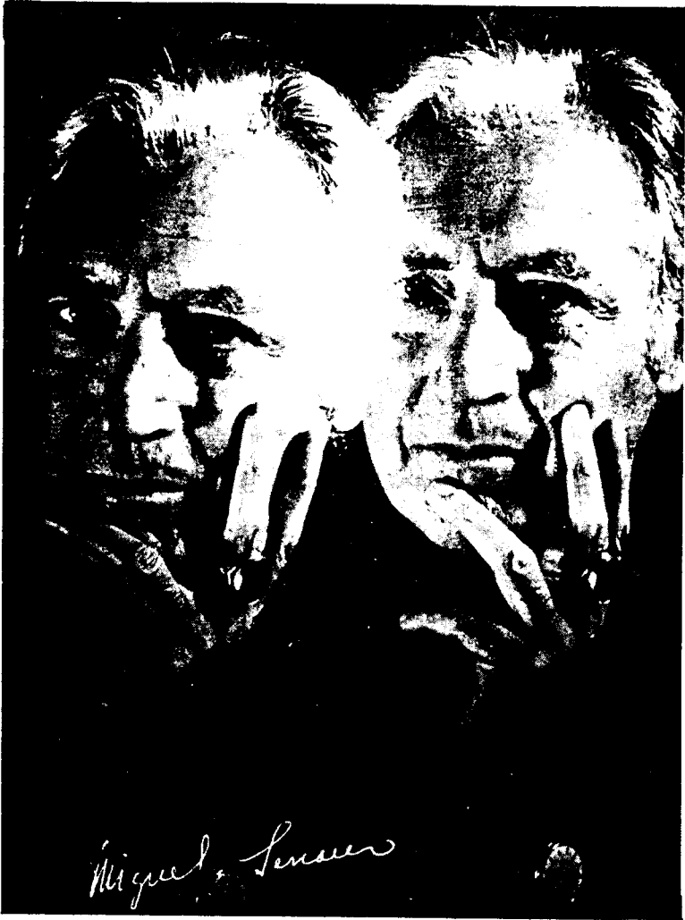
MIGUEL SERRANO : Nacido en 1917, en Santiago de Chile. Viajó a la Antártica en 1947 - 1948. Embajador en India, desde 1953 a 1962. Embajador en Yugoslavia, desde 1962 a 1964. Acreditado a la vez en Rumania y Bulgaria. Embajador en Austria desde 1964 a 1970. Embajador ante el Organismo Internacional de Energía Atómica en Viena y ante el Organismo de las Naciones Unidas para el Desarrollo Industrial (UNUDI).