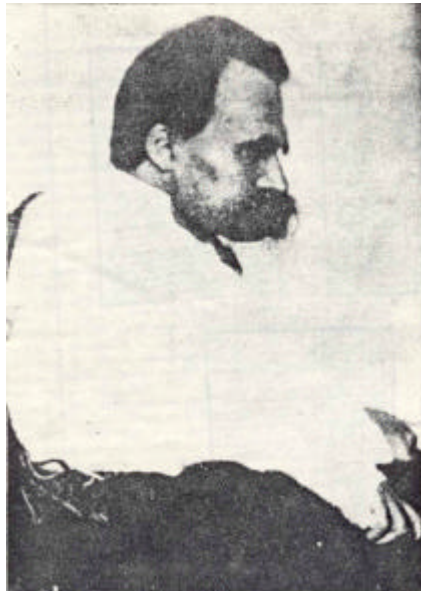
Nietzsche, en la locura

Hasta 1930, sólo se conocían estas tres partículas elementales como las constituyentes últimas de la materia. Pero hoy se han descubierto decenas de otras partículas, que se originan en la radiación cósmica, o en los laboratorios. Se piensa ya en la existencia de otras partículas aún más elementales, posiblemente ni siquiera elementales, ni siquiera partículas, a las que se denomina con los más curiosos o estafalarios nombres del "slang", o jerga de los matemáticos y físicos cuánticos, que hoy se dan a "cazar" este tipo de partículas invisibles en los laboratorios.