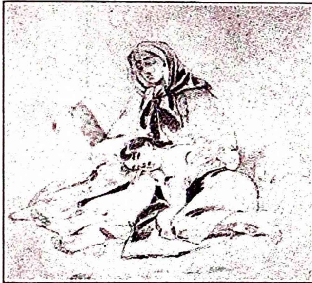
Образець цей намальований Тарасом Шевченком