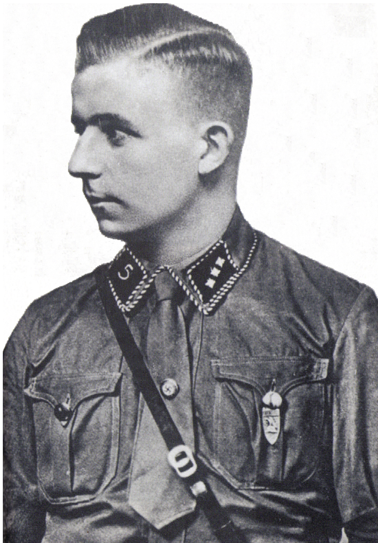
Horst Wessel, ledare av Storm 5 i Berlin (1907-10-09 - 1930-02-23)